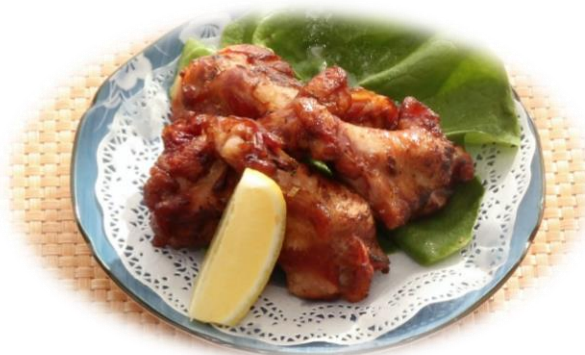
炙りスモークチキン 税込990円