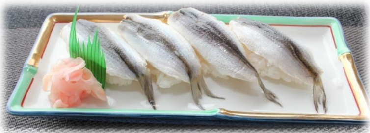
ママカ리의にぎり寿司 税込990円

「飯借り」と書き、「飯がすすみ、家で炊いた分を食べ切ってしまってもまだ足らず、隣の家から飯を借りて来なければならないほど旨い」に由来しています。ニシン科で、一般的には「サツパ」と呼ばれています。