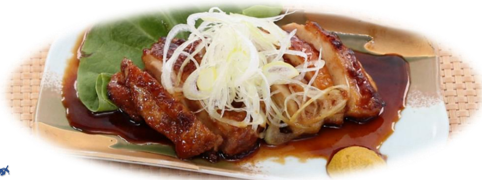
料理長おすすめ 鶏モモ肉の照り焼き 税込1,380円