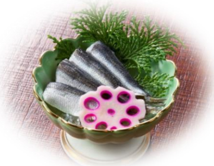
ママカ리의酢漬け 税込700円