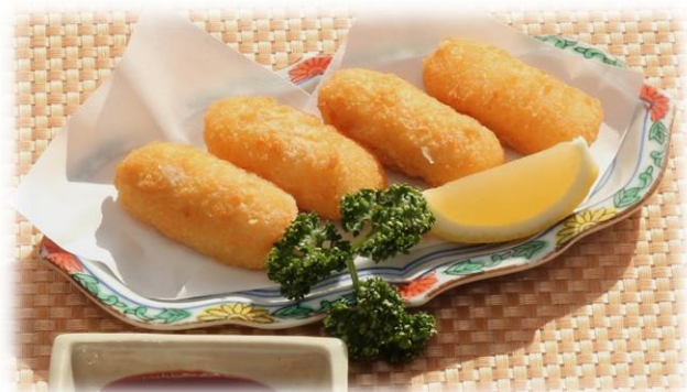
鶏ささみチーズフライ 税込770円