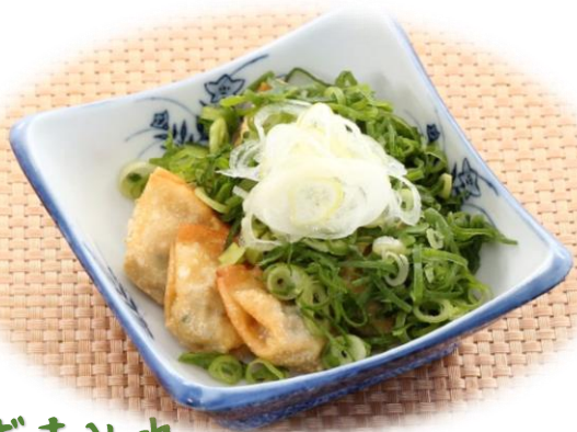
ネギまみれ ピリ辛ひとくち揚げ餃子 税込880円