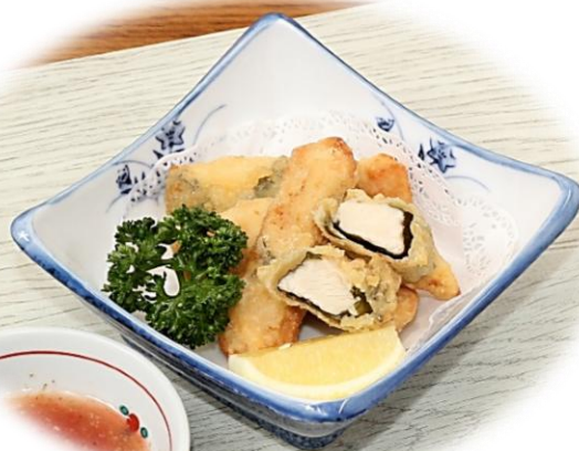
フライドチキン 990円 (税込)