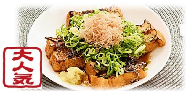
ネギまみれ 焼き厚揚げ 880円 (税込)