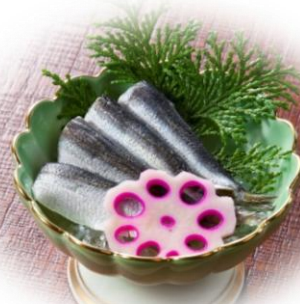
ママカリの酢漬け 700円 (税込)