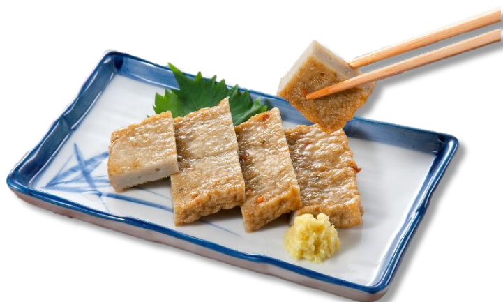
宇和島のじゃこ天 720円 (税込)