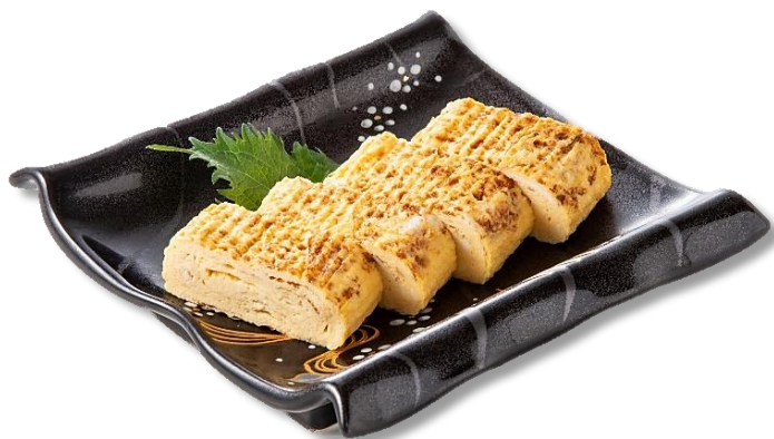
昔ながらの卵焼き 880円 (税込)