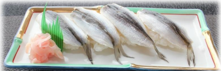
ママカリののにぎり寿司 990円 (税込)

「飯借り」と書き、「飯がすすみ、家で炊いた分を食べ切ってしまってもまだ足らず、隣の家から飯を借りて来なければならないほど旨い」に由来しています。ニシン科で、一般的には「サッパ」と呼ばれています。