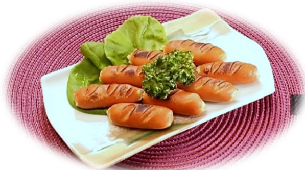
ピリ辛ウインナー 880円 (税込)