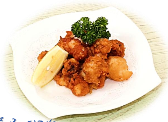
大人気ふかつメニュー たこ唐揚げ 1,280円 (税込)